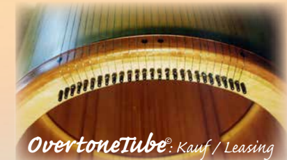
mit WoEnd-Seminar Einführung in Spielweise und Umgang

Diese Hörsphäre innerhalb des bioakustischen Schwingungsfeldes öffnet eine dynamische und sich entfaltende Wahrnehmung und den psychosomatischen Raum.